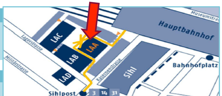
Wegbeschreibung zur Pädagogischen Hochschule

Kosten je Abend mit drei Referaten: CHF 25.-- für Mitglieder CHF 30.-- für Nichtmitglieder